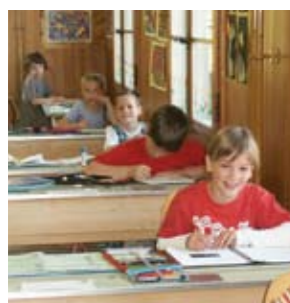
Einzelarbeit im Wochenplan

Natürlich sind die Schülerinnen und Schüler in der Moosackerklasse nicht nur verschieden alt: Verschieden sind die Elternhäuser mit ihren Wertesystemen, verschieden sind die Begabungs- und Lernstandprofile, gross ist auch hier die Bandbreite der Selbst- und Sozialkompetenz. Und spürbar ist der Wunsch der Lehrkräfte, dieser Vielfalt gerecht werden zu können. Uns beeindruckt die intensiv gelebte Lerngemeinschaft. Wir kamen auf der Suche nach Heterogenität – und finden eine homogene Lernkultur auf beeindruckendem Niveau. Was macht diese Klasse so rund und ganz? Wohl gerade auch das Wissen um die selbstverständliche Unterschiedlichkeit. Dieser hochkomplexe Unterricht kann nur gelingen, wenn alle spüren, dass sie einzeln auf die Rechnung kommen, – und wissen, dass es dazu die Hilfe aller braucht.