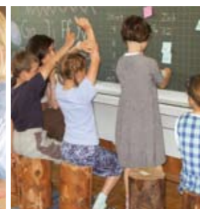
Mathematik zweite Klasse.