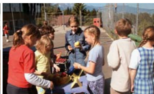
Die Jüngste führt das Pausenlädli.