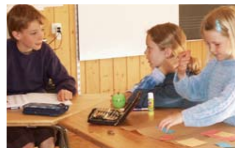
Deutsch vierte Klasse – Mathematik erste Klasse.