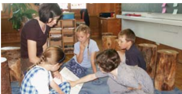
Kreis zweite Klasse: Tauschrechnungen