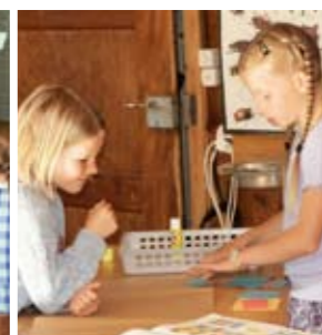
Ich erkläre dir die Aufgabe.