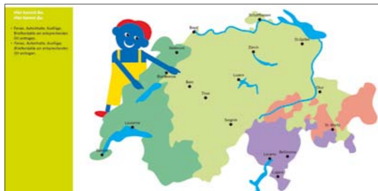
Abb. 1: Schülerinnen und Schüler werden ermutigt, schriftlich «Kontakte zu Sprachen und Kulturen» in der Schweiz und auf der ganzen Welt zu reflektieren.

Im Portfolino dienen die 20 exemplarischen Aktivitäten, die der Lehrperson in den Handreichungen angeboten werden, als Basis für diese reflexive Arbeit. Dazu ein Beispiel: «fünfter sein», ein kleines Gedicht von Ernst Jandl, das sich im Wartesaal eines Arztes abspielt (Abb. 2). Die Lehrperson erzählt die Geschichte ein erstes Mal mit der Hilfe von Bildern und Intonation. Während oder nach dem Erzählen versichert sie sich, dass die Geschichte verstanden worden ist, und verteilt die Rollen: Wer möchte