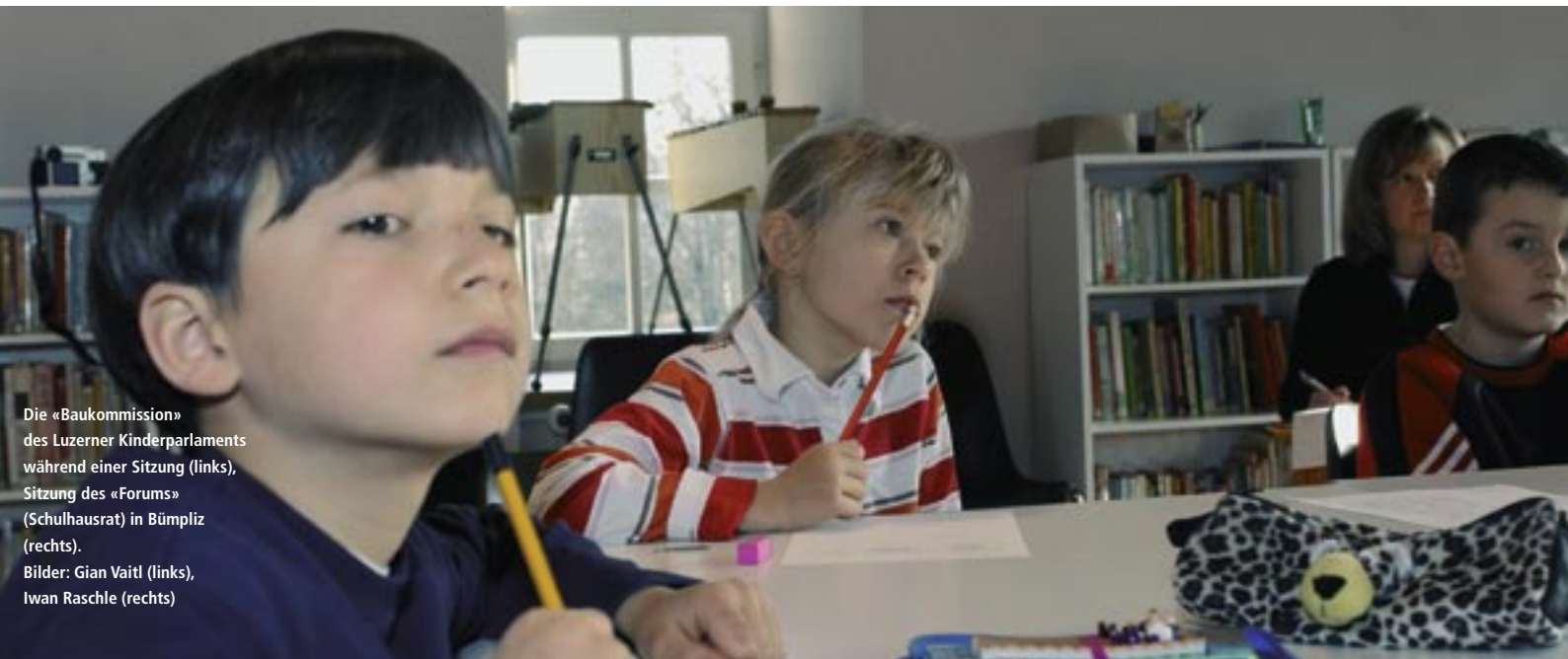
Die «Baukommission» des Luzerner Kinderparlaments während einer Sitzung (links), Sitzung des «Forums» (Schulhausrat) in Bümpliz (rechts).