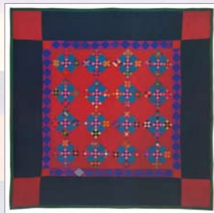
«Double Ninepatch» aus: «Quilts – die Kunst der Amischen», Edition Stemmler

Auftakt in ein neues Unterrichtsvorhaben: Die Lerngruppe analysiert im Plenum das Bild eines historischen Quilts der Amischen, bevor mit einem eigenen Entwurf für eine kleine Quiltarbeit begonnen wird.